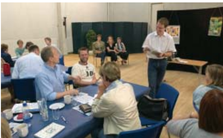
I forumteater inviteres publikum til dialog og direkte deltagelse. Der er ingen „rigtige“ meninger, men et tilbud om at afprøve forskellige muligheder her og nu på scenen.

Men årsagen til problemet kan ikke ses løst fra det, der i øvrigt foregår på arbejdspladsen – de kollegiale samarbejdsrelationer, ledelsens måde at lede på, samarbejdet med børnene og deres forældre, med brugerne og deres pårørende eller andre institutioner for blot at nævne nogle enkelte af de ting, der har betydning for tunge løft. Derfor handler teaterforestillingerne ikke kun om at løfte, hjælpe-