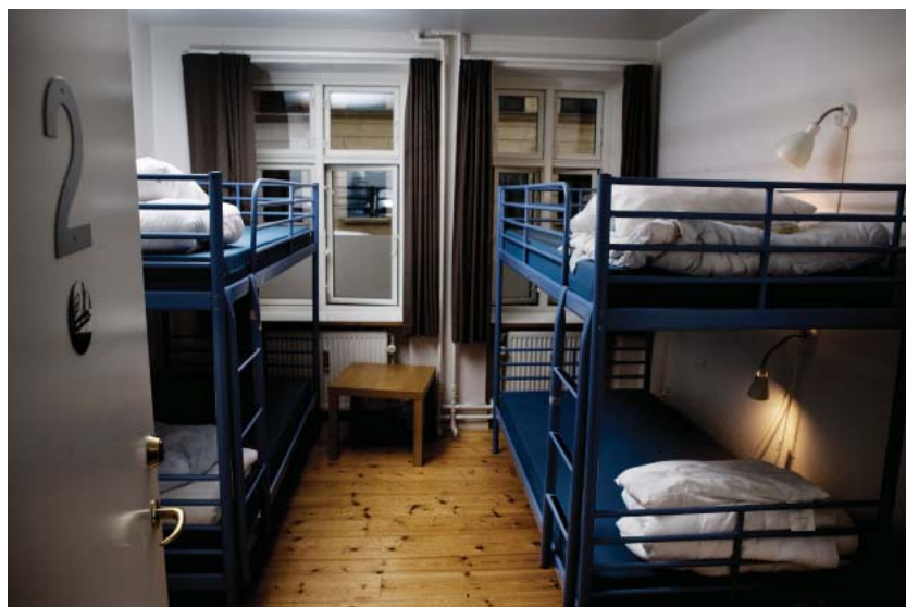
Redens Nathjem har 14 sengepladser. Det er ikke en permanent løsning – man har mulighed for at bo her i en måned, eller at overnatte en gang om ugen i en længere periode.

– Det er vigtigt hele tiden at være opmærksom