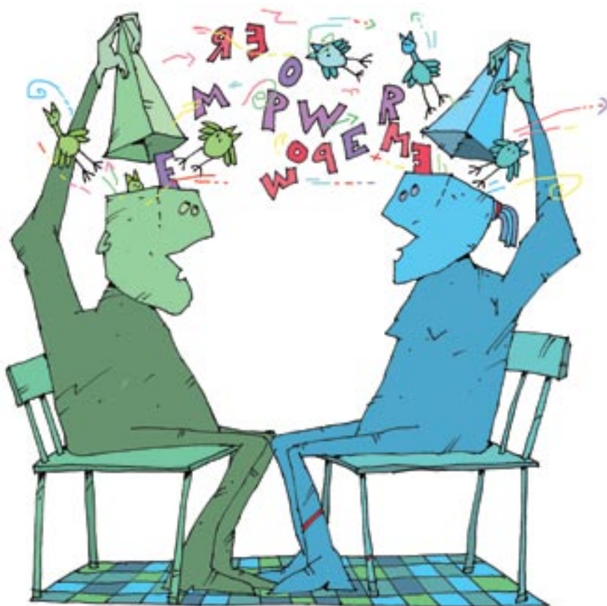
ILLUSTRATION: ALLAN STOCHHOLM