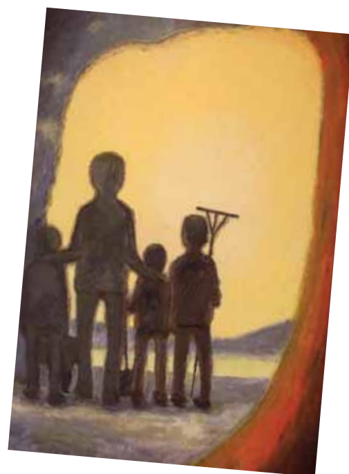
Fra "fordærvede" unger til gode borgere med en håbefuldst fremtid - forsiden af bogen om Oustruplund prydes af dette maleri af Tage Bjerring

I dag er Oustruplund et moderne socialpædagogisk beskæftigelses- og behand-